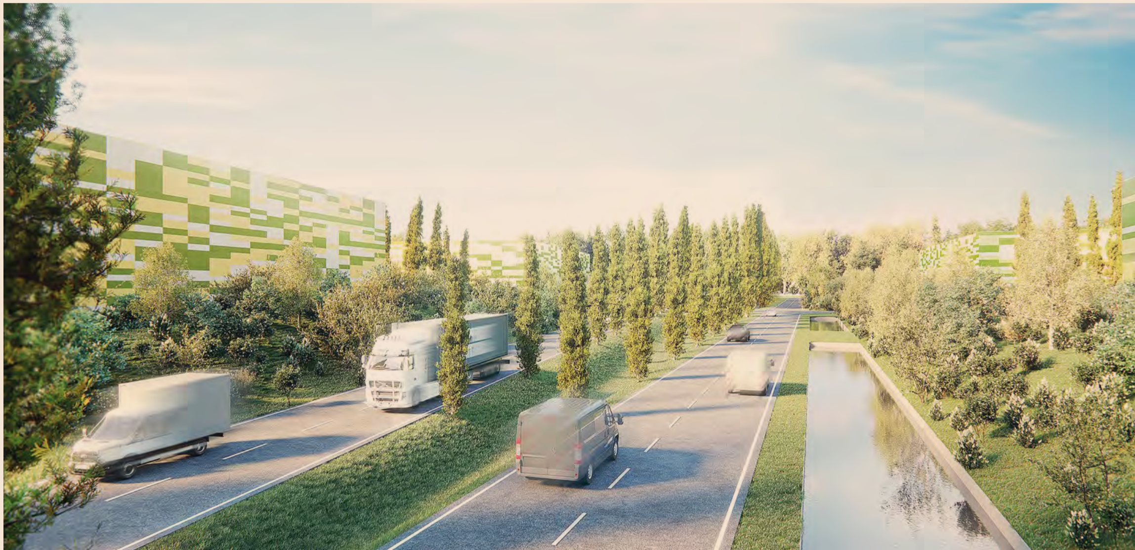
Progetto green. L'area sarà per metà destinata a superficie lorda di pavimento mentre il rimanente a verde. Il polo logistico cambierà volto al territorio grazie a un investimento di circa 200 milioni di euro senza attivare nessun consumo di suolo

-10,2% FLESSIONE PREVISTA PIL LOMBARDO 2020